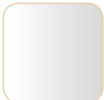
SREBRNE SILVER / L01 / L01

DOSTĘPNE KOLORY LUSTRA available mirror colours