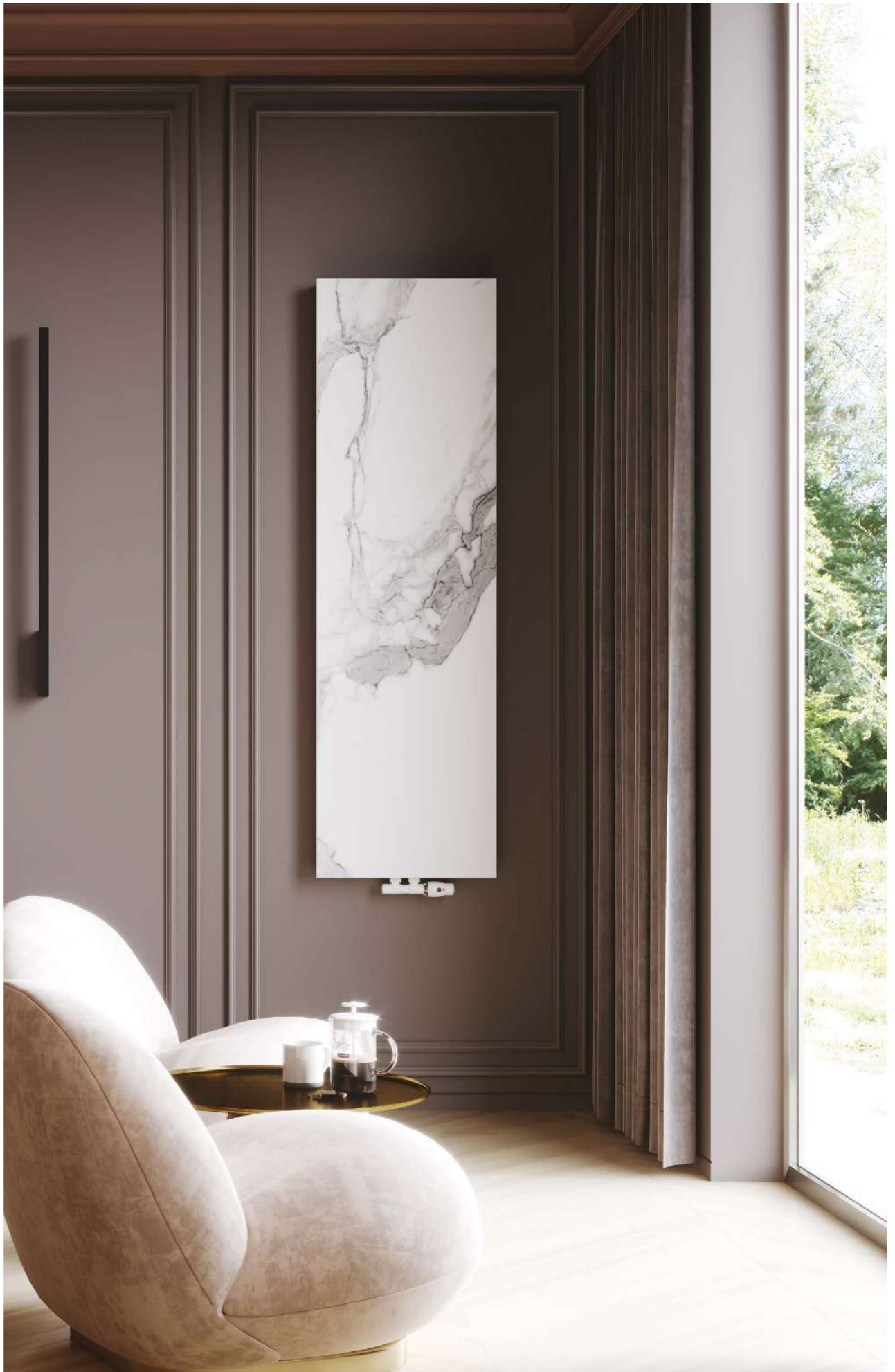
Na aranżacji: grzejnik c.o. IND-50/160E34SK1, zestaw zaworowy Z15 In the visualisation: IND-50/160E34SK1 heating radiator and Z15 valve set