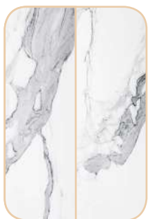
IND-40/120E34SK1 | IND-50/160E34SK1

DOSTĘPNE WERSJE SPIEKU available quartz sinter