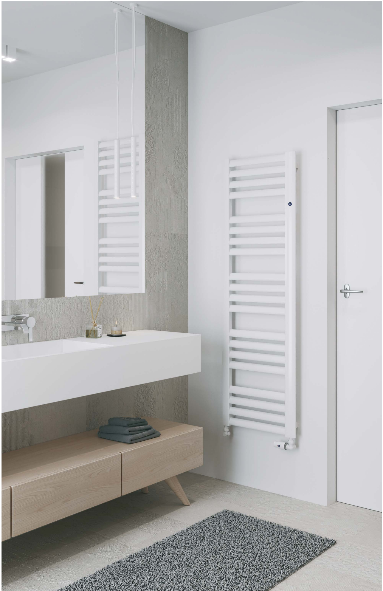
Na aranżacji: grzejnik c.o. MAK-50/160, zestaw zaworowy Z14 In the visualisation: MAK-50/160 heating radiator and Z14 valve set