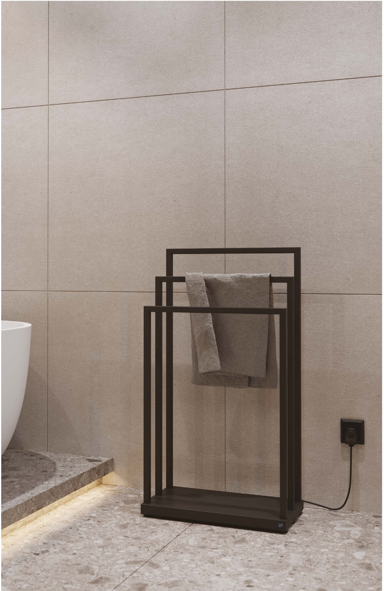
Na aranżacji: grzejnik elektryczny MOBE2-50/90C31 In the visualisation: MOBE2-50/90C31