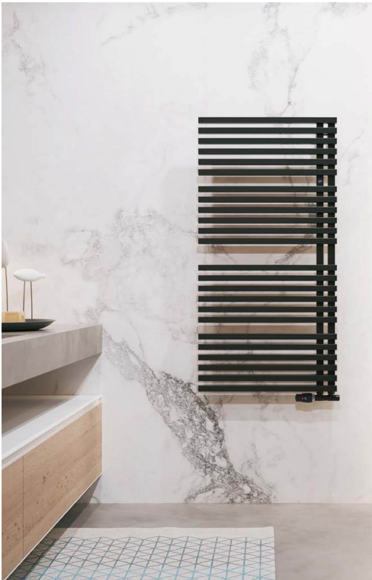
Na aranżacji: grzejnik c.o. GLT-60/120C31, zestaw zaworowy Z15