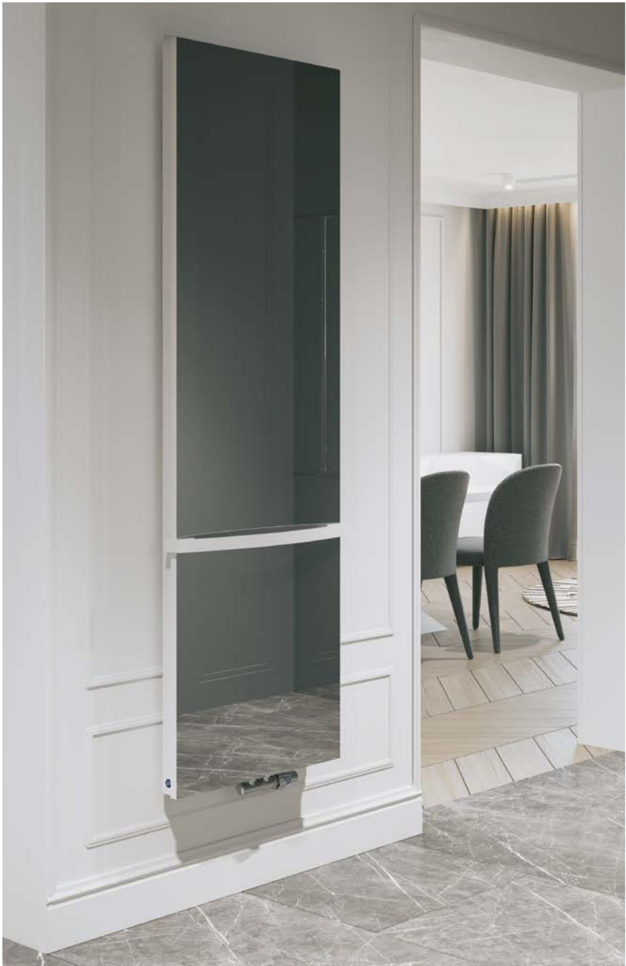
Na aranżacji: grzejnik c.o. IND-60/180E34L01, zestaw zaworowy Z15