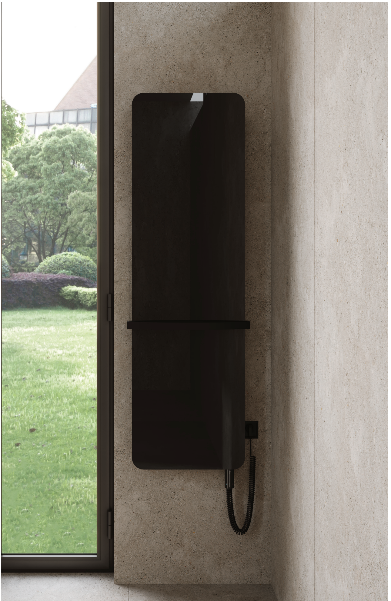
Na aranżacji: grzejnik elektryczny INDNE-50/160E31L05+GH-09C2, reling RS4-50C31 In the visualisation: INDNE-50/160E31L05+GH-09C2 electric radiator and RS4-50C31 rail