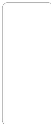
Wysokość 1164 mm