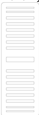
Wysokość 1800 mm